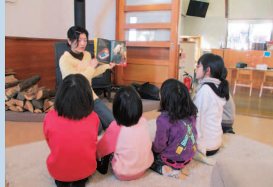
薪ストーブの前でゆっつりと…。