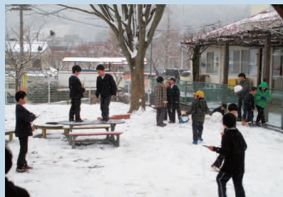
久万氷りではの遊び!! 寒まじらずの子よもち。