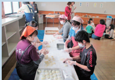
今年のおもちはどんな味がかな? お楽しみに!