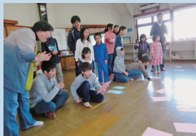
レクPart②童話カードで盛り上がっています。