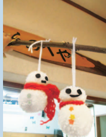
冬本番! 子よもちの作品。

「先生、一緒にけん玉やろう？」Aくんの誘いに「やろう。やろう。」と、けん玉の練習開始。なかなか思うようにできない二人。「おいしい。もう少し。いい調子。」と励まし合いながら、けん玉をしていると、隣で遊んでいた1つ年上のBくんが、「こうやるといいんだよ」「足は曲げて」「リズムよく」と、Aくんに丁寧に教えてくれました。二人の様子があまりにも微笑ましかったので、そっとその場から遠ざかりました。子ども同士、共に生活する場で、信頼できる関係作りが自然にできる。これからも、きょうだいのように育ててほしいと思います。(大堀 純子)