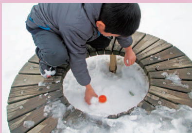
雪の中で宝探し…見つけよ!