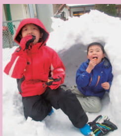
宝物を見つけ、かまくりの中で冷凍みかん食べました。