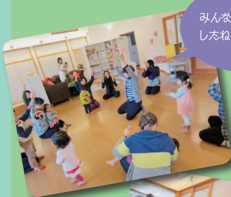
みんなで楽器をならしたね!