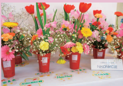
花育キッズ*フラワ-フェスティバル参加*可愛い作品が展示されました。

平成27年度NIKO NIKO 館のイベントでは、地域の方、ボランティアの方々にご協力頂き、どのイベントも楽しく盛り上がり、皆さんの笑顔をたくさん見ることができました。