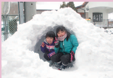
大きなかまくり完成!