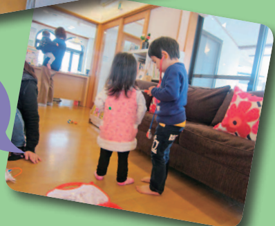
小まなお医者さん

ある日のふれあい広場のことです。3歳の元気な男の子が、おもちゃの聴診器を使ってお医者さんごっこを始めました。すると、近くにいた2歳の女の子がおもちゃに興味をもち、近づいてきました。以前の男の子なら、「僕が使うの!!」とおもちゃの取り合いになったでしょう。でも、この日は様子が違っていました。近づいてきた女の子の胸に、聴診器を当てお医者さんごっこが始まったのです。女の子も大人しくうれしそうに診てもらっていました。その様子に気付いたお母さん達、スタッフは二人の様子がかわいらしくて、顔を見合わせ思わず笑っていました。4月からの一年間で、Happy Houseには、乳幼児の親子さん、幼稚園・保育園児、小学生、地域の方など大勢の方に利用していただきました。初めての出会いでは、なかなか打ち解けられなかった相手とも、何度か顔を合わせるうちに知り合いになり、交流ができました。Happy Houseがこれからも来館されたみなさんの出会いの場、ほっとくつろげる場となりますように、スタッフもさりげなく支援していきます。そして、地域における憩いの場になるように、今後もさらにつながりを広げていきたいと考えています。