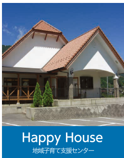
Happy House 地域子育て支援センター

〒791-1201 愛媛県上浮穴郡久万高原町久万1447 TEL:0892-21-0777 FAX:0892-21-0772 hoiku@ikuwa.or.jp