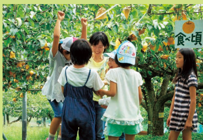
味覚狩り(あま〜い梨と) 8月28日 13名参加