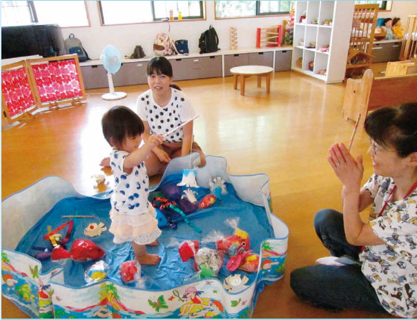
おまかひ、つれたよ～