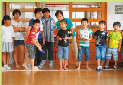
婦人会さんとディスコン大会 8月18日 27名参加