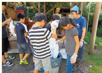
由良野の森で自然体験