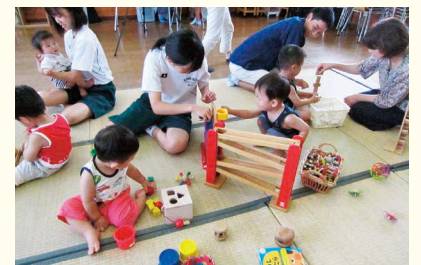
ふれあい体験での一コマ