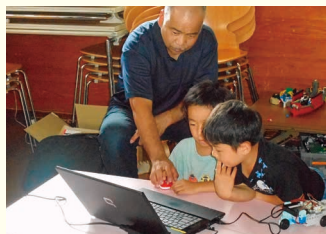
ロボットで遊ぼう

どんどこプロジェクトの活動で、藍染め体験や自然体験を行いました。青空の下、藍染めしたTシャツが青々と輝いていました。また久万高原の自然に改めて感謝! 子どもたちと自然を満喫した1日でした。