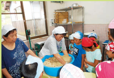
手作りこんにゃく 初体験! 8月10日 12名参加

子どものささやかな芽、あの子にこの子にこんな力が…驚きの成長を日々感じて。NIKO NIKO 館に集まる子どもたちは、ここでどんな出会いをし、どんな経験をしているのでしょうか。館内では、エントラスホールでおしゃべりをしたり、各遊びのコーナーでじっくり活動したり、クラフトコーナーでお気に入りの制作や、ボードゲームで友だちと対戦、また2階の絵本コーナーでゆったりと過ごしたり、色々な場所でいろんな経験をしています。時々、作品をみて驚かされることも…。また労りの姿に関心することも…。いつも間に…この子にこんな力ができたのだろう。私たちスタッフは、一人ひとりの力を見逃さず、その力を一緒に喜び、さらなる力の飛躍へと繋げていきたいと思えます。(大堀 純子)