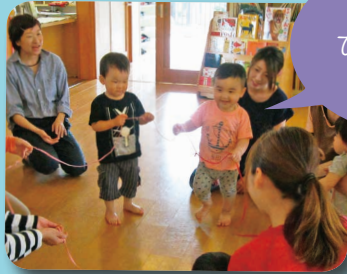
ひらいたひらいた