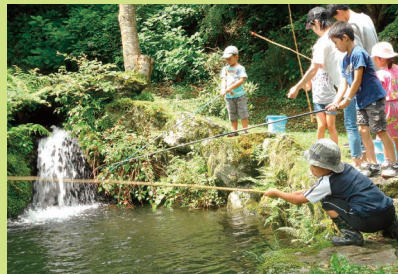
釣り体験 ぶんな魚が釣れるかな? 8月10日 12名参加