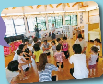
みんなでいっしょに