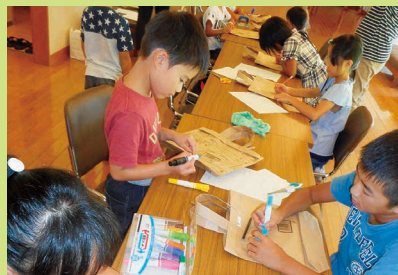
美術館でエコバック制作 8月17日・24日 合計19名参加