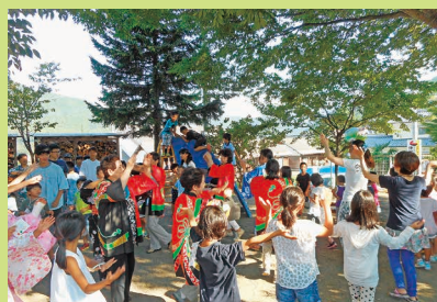
夕涼み会 盆踊り みんなで楽しみました! おもひで作り 8月30日 36名参加 夕涼み会 8月30日 約100名参加