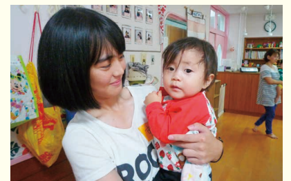
上浮穴高校の生徒さん