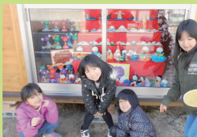
くまちゃんまつり4・23までNIKOのあひなさまも見逃しなく