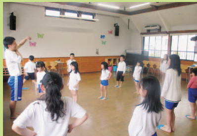
3月までには…とび箱〇〇段 チャレンジ

NIKO NIKO 館は、地域のすべての子どもが利用することができる遊びと福祉の拠点施設です。NIKO NIKO 館(児童館)では、NIKO NIKO クラブ(学童保育)と放課後子ども教室を行っており、放課後等に子どもが安心して活動できる場の確保を図り、児童の健全育成の支援を行っています。今年度も、子ども集団だけでなく、自分の周りにはいろいろな人がいることを知り、お互いに良い刺激を受けながら成長できるように、地域との連携を進めていきます。子どもたちの未来に繋がるような支援ができるよう、家庭・地域と共に一人ひとりを見守りたいと思います。(大堀 純子)