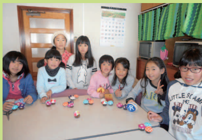
可愛い小物完成!針と糸が上手になりました