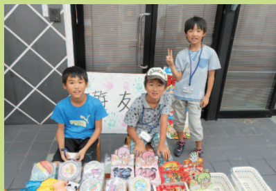
ボランティア活動&いろんな交流しよう!