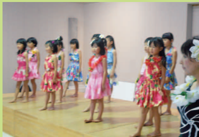
アロハ～☆フラダンス一緒にしましょう