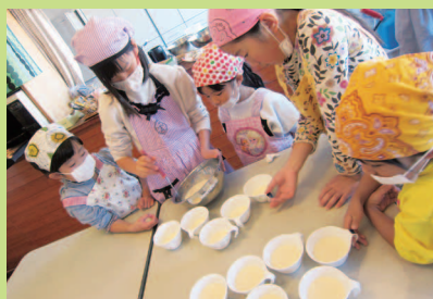
美味しいスイーツ作りましょう♡