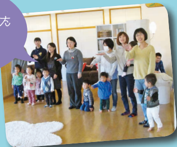
手話で歌いました 「心のねっこ」