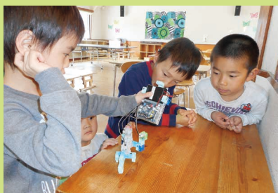
動いた! 光った! 自分で作ったロボット完成