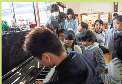
ピアノの音色に導かれて…みんなうっとり