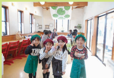
地域café 今日のおもてなし