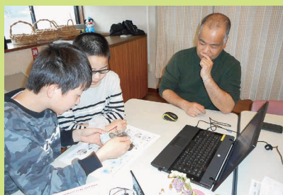
アブロックで動くロボット制作中