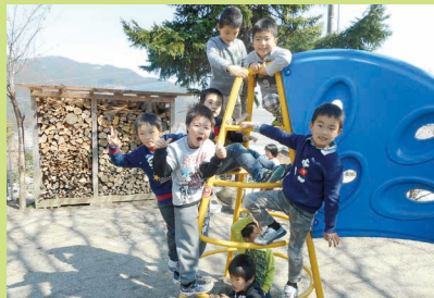
新年度スタートしました!!