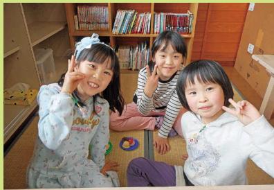
Newコーナーでうっとり