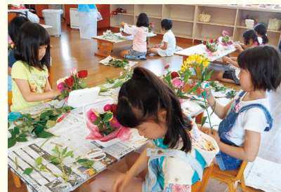
おの花はしようかな…。