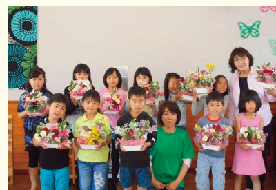
フラワーボックス完成