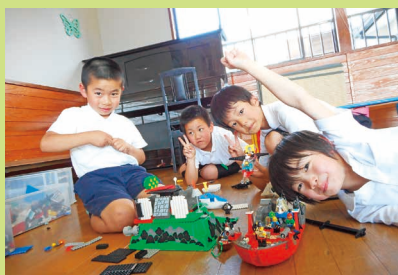
レゴワールド…みんなで完成!