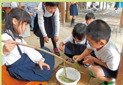
まっ実験開始! どうなるのかな?