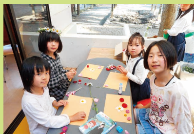
素敵なお花を使って…癒しの時間