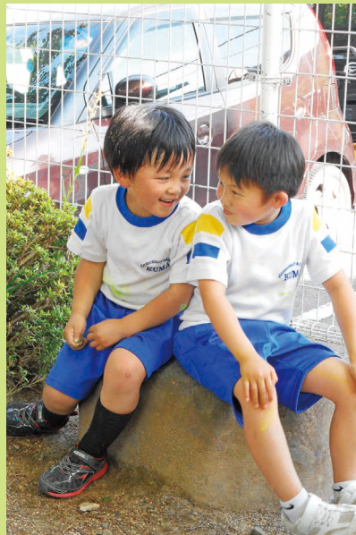
あのね…うんうん…石の上でまったり