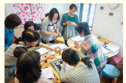
Happy Houseでアロマクラフト体験