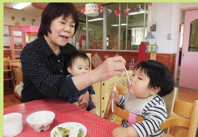
食事 「アーン」「おいしいね」心が共有します。食事タイムは大切なコミュニケーションの時間です。