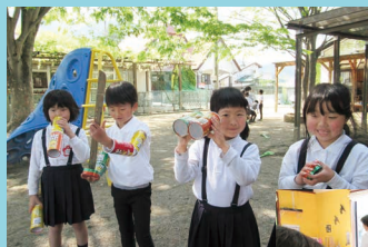
こんなのが出来ました!

手作りを楽しむ工作遊びは、子どもたちの創造性を養い、手先の器用さを身につけるだけでなく、物の性質を理解するためにも、とても重要な遊びのひとつです。NIKO NIKO クラブの子どもたちも手作りするのが大好き!色水と半紙で染めもの遊び。毛糸でポンポンを作ってオリジナルマスコット作り。お菓子の空き箱ひとつあれば、子どもたちの制作意欲は無限大です! (渡部 梨香)