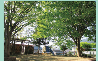
大きなケヤキがシンボルツリーめです。

→ NIKO NIKO 館の庭は、木陰で涼しく、ごっこ遊びやねじりん遊具、一輪車やサッカーやドッジボールを楽しむ