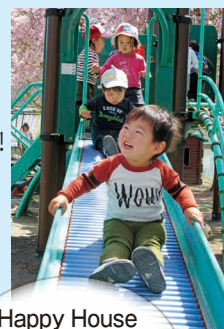
すべり台 楽しいね!