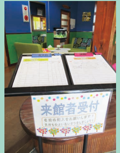
気持ちの良いあいまつと来館・降館に記入しましょう