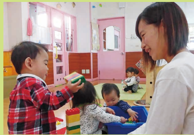
遊び 一緒に遊びながら「楽しい」「まじろしい」という気持ちがふくらみます。