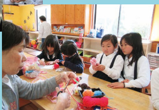
一年生の手芸入門