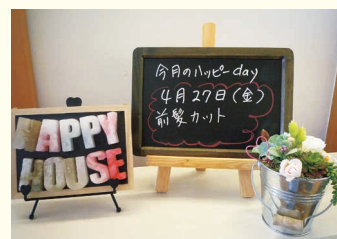
「今月のハッピーday」の案内ボードでお知らせをします♡

身近な地域の方を講師にお招きして、お手玉や折り紙などの昔遊びをする日もあれば、前髪カット・ハンドマッサージの日もあります。赤ちゃんの笑顔に癒されながら、みんなで楽しくゆったりとハッピーな時間を過ごしましょう。ハッピーハウスは、どなたにも利用していただける場所です。地域の皆さんお待ちしています。(今井 久美子)