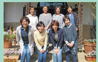
笑顔・癒し・元気・若さを自信ありのスタッフです

→ NIKO NIKO 館にはたくさんのスタッフがいます。何でも声をかけて下さいね。来館される皆さんとのおしゃべりタイムを楽しみにしています。