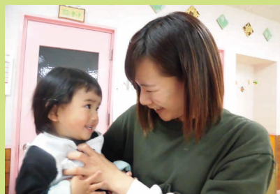
ふれあい 向かい合って、声としくまでふれあい遊び。親密さが深まります。