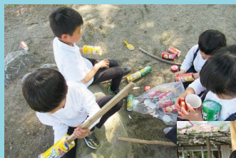
何つくろうかなー...