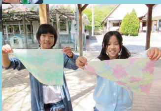
色水で染めました!