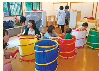
簡単トンネルに入って自由に遊ぶ子どもたち