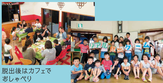
脱出後はカフェでおしゃべり