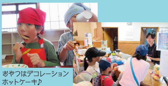
おやつはデコレーションホットケーキ♪

夕食後は、夜の児童館を楽しむ親子のイベント「リアル脱出ゲーム」を企画。親子1チームで懐中電灯を手に、薄暗い館内で、ミッションをクリアしながら、出口を目指しました!そして、最後は宴の間(かぜのへや)でゆったりカフェを楽しみました。(渡部 梨香)