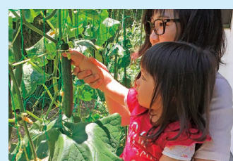
私が植えたきゅうりがとれたよ