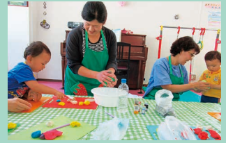
みんな不思議な感触に興味津々