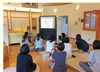
パワーポイントで紹介される子ども園の様子を見るお母さんたち