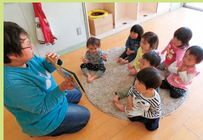
みんなお話の世界に夢中になっています