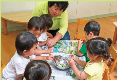
「豆がいっぱい入ってるね。何のメニューに「キャー冷たい!! 気持ちいい!」なるのかな?」