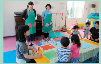
いちごのエプロンでごあいまつ

様々な粘土の色、感触、形に触れ、また想像力を膨らませ作品を作り、親子で楽しいひと時を過ごしました。