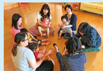
めいこ先生とあそぼう