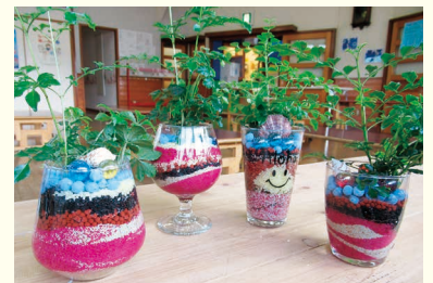
グリーンカクテル