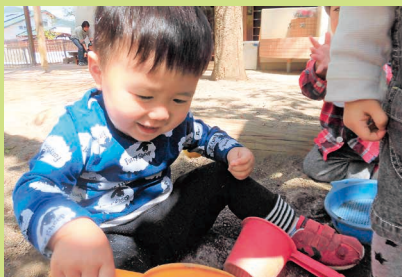
ほ～ら、上手にすくえちよ！（^▽^）