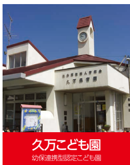
久万こども園 幼保連携型認定こども園

蚊が飛ぶ季節になりました。忘れた頃にやってくる憎いヤツ。殺虫剤を置いて万全の体制を整えたいと思います。