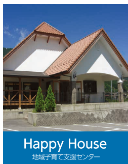
Happy House 地域子育て支援センター

〒791-1201 愛媛県上浮穴郡久万高原町久万1447 TEL:0892-21-0777 FAX:0892-21-0772 hoiku@ikuwa.or.jp