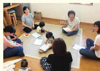
ワークシートを用意してペアレント・トレーニング