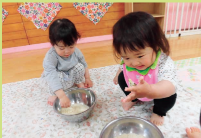
パン粉粘土をこねこね。「手はくっついた～、＼(〇o〇)/」「見て～！あわあわー。」「おのタライに入ろうか～。」