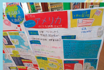
世界丸見え大調査 マップ完成!