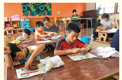
手びねり初体験（陶芸体験）