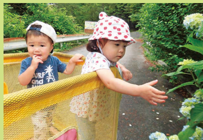
この葉っぱ大きいよ！何か光ってる！