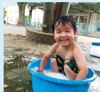
あわあわ～気持ちいい!