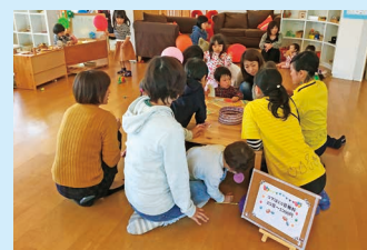
つどいの広場スタッフによる遊びのコーナー