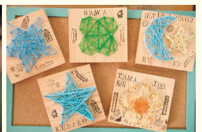
木製プレート完成