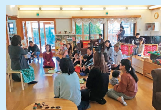
ママたちの交流会