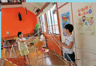
骨組みはもうしたろうまくいくかな？